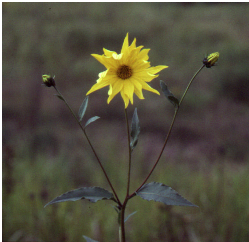
Abb. 1: Der Topinambur ( Helianthus tuberosus ) blüht erst im Herbst

Wird Topinambur in unseren Gärten noch als Gemüsepflanze angebaut? Die Knollen sind ja im Handel erhältlich. Sie schmecken roh wie unreife Haselnüsse und gekocht ähnlich wie Artischocken, mild-nussig und süßlich. Da sie als Inhaltsstoff vor allem Inulin – einen aus Fruchtzucker aufgebauten Zucker - enthalten, werden sie gern als Kost für Diabetiker empfohlen, weil der Körper zu dessen Verarbeitung das Insulin nicht benötigt. Aber obwohl sie vor 200 Jahren als amerikanische Knollenpflanze noch mit der Kartoffel konkurrierten, hat diese doch den Sieg davon getragen. Topinambur ist etwas für Menschen, die das besondere Gemüse schätzen. Am besten wird die Knolle gut geputzt und ungeschält mit etwas Zitronensaft zu einer Rohkost verarbeitet.