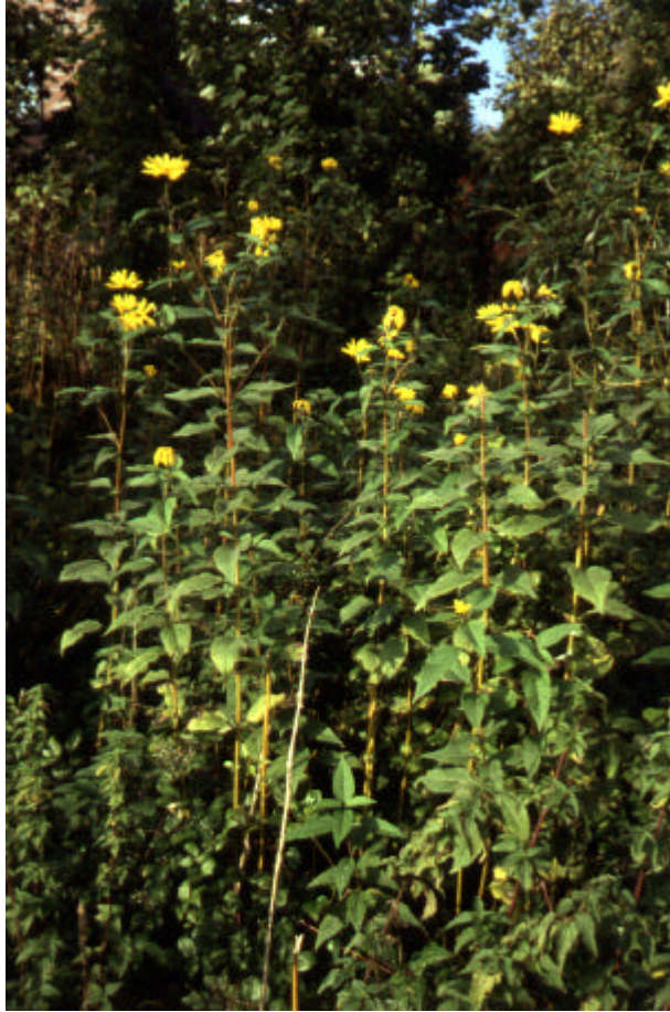
Abb. 2: Topinambur kann dichte Bestände bilden und über 2 m hoch werden

Die Knollen werden im Juli und August gebildet und sind im Gegensatz zur Kartoffel winterhart. Sie können selbst noch im Frühjahr geerntet werden. Dies ist sowieso zu empfehlen, denn Topinambur-Knollen trocknen leichter aus als Kartoffeln und sind daher weniger gut lagerfähig. Die Frage ist nur, wie man sie später wieder los wird, denn bei der Ernte bleiben immer einige im Boden zurück, die später wieder austreiben. Hier hilft nur Geduld.